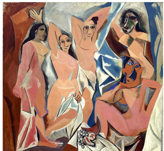
Les demoiselles d'Avignon (1907)