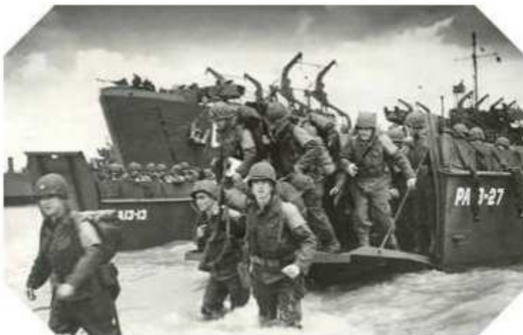
Débarquement américain en Normandie le 6 juin 1944

Les soldats américains (aussi appelés G.I.) ont été les principaux acteurs de la libération de l'Europe à la fin de la Seconde Guerre Mondiale. C'est notamment grâce au débarquement allié (Etats-Unis, Canada et Royaume-Uni) en Normandie le 6 juin 1944, que la France, puis l'Europe entière ont pu être libérés des nazis.