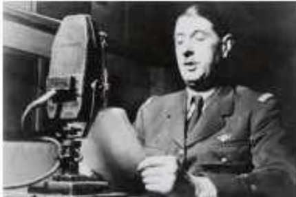
Le général de Gaulle appelle à la résistance

Vingt ans après la Première guerre mondiale, la France est de nouveau en guerre contre l'Allemagne dirigée par Hitler. La France n'est pas prête à faire la guerre. En cinq semaines d'une « guerre éclair », l'armée française est anéantie. Deux millions de soldats sont prisonniers.