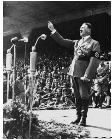
Hitler prononce un discours

Organisés sur le territoire allemand dès 1933, les camps de concentration étaient destinés à enfermer des individus « jugés dangereux » par le régime nazi. Entre 1939 et 1945, environ 6 millions de Juifs sont exterminés par les nazis.